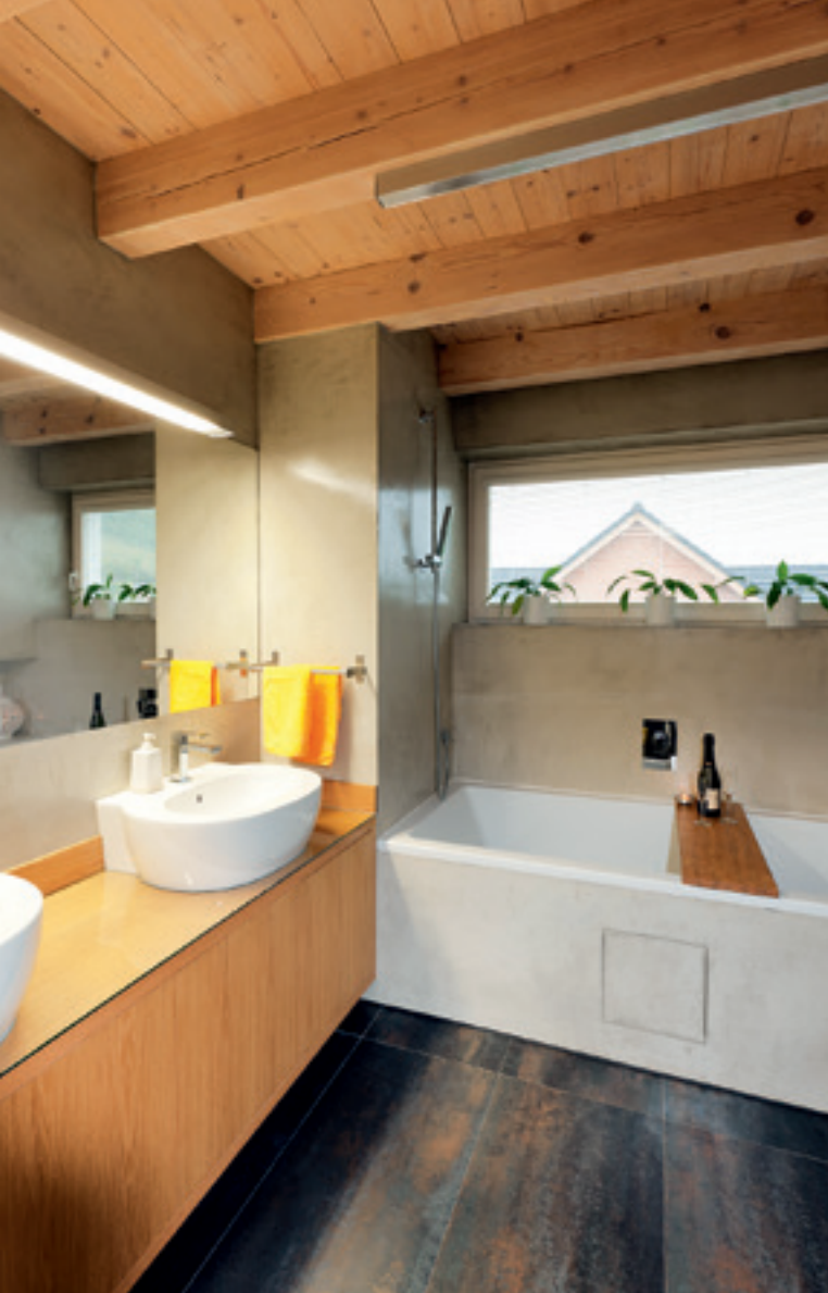
Přiznané dřevěné trámy a pohled vytvářejí specifickou atmosféru

půda. Dům je částečně podsklepený, sklep přístupný zvenku je určen pro skladování zahradního nářadí a podobně.